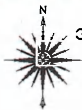
Схема планировочной организации земельных участков с К№ 71:30:080218:695, К№ 71:30:080218:696